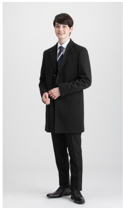
ULTRA MOVEチェスターコート